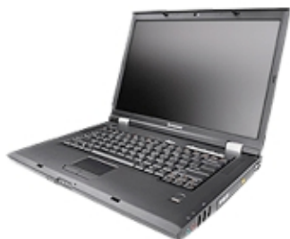
Abb. kann vom Original abweichen.

(TopSeller)/ 15,4 Zoll/ WSXGA+ (1680x1050) Pixel/ Intel Core Duo T2400/ 1800 MHz/ 1024 (2x 512) MB RAM/ 100 GB HDD/ Double Layer DVD+/-RW/ nVidia GeForce Go 7300/ Ethernet 10/100-TX, Modem, WLAN 802.11a, WLAN 802.11b, Bluetooth, WLAN 802.11g/ Win XP Home