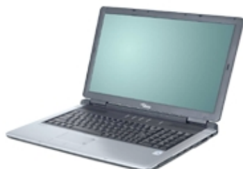
Abb. kann vom Original abweichen.

17,0 Zoll/ WXGA+ (1440x900) Pixel/ Intel Core 2 Duo T5500/ 1660 MHz/ 1024 (2x 512) MB RAM/ 120 GB HDD/ Double Layer DVD+/-RW/ NVIDIA GeForce Go 7600/ Bluetooth, WLAN 802.11g, WLAN 802.11b, WLAN 802.11a, Modem, Ethernet 10/100/1000B-TX/ Win XP Home